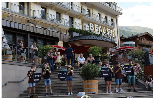
Un sextuor de trombones lors du concert devant l'Hôtel Beausite, ses clients et sa terrasse.

Si depuis le village le fameux Cervin est souvent visible, par contre un relief terrestre occulte le non moins fantastique massif du Mont Rose, tout aussi impressionnant avec ses fameux glaciers craquelés, partant du Petit Cervin et du Breithorn, jusqu'à la Pointe Dufour, en passant par Castor & Pollux et le Liskamm. À la mesure de l'ascension ferroviaire, celui-ci se dévoile, dominant. C'est dans ce décor majestueux et avec un vent frais provenant de cette chaîne intimidante que l'ensemble s'époumona une nouvelle fois pour proposer de petits concerts éphémères aux quelques touristes cosmopolites de passage. Couplés à la vue de surplomb saisissante, l'altitude à plus de 3000 mètres et le climat quelque peu exotique ont rendu cette expérience de