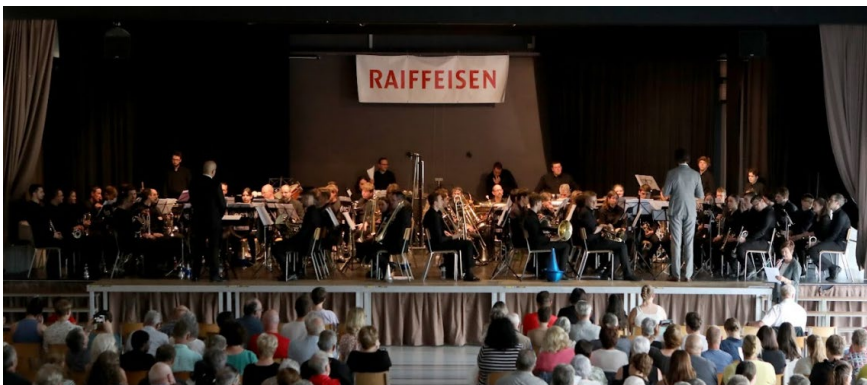
L'ECJ A et B interprétant Becoming Giants côte à côte.