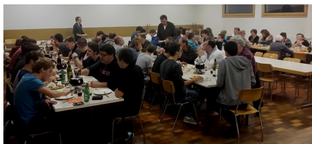
Les repas avec la traditionnelle fondue paysanne du samedi