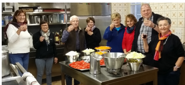
Une partie de l'équipe de cuisine 2015. Un grand MERCI !