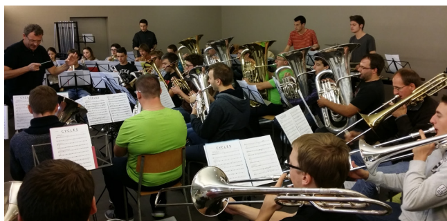
Après 2 jours de partielles, l'ECJ A en ensemble au Noirmont