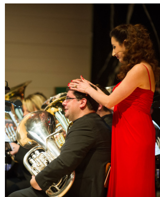
Des moments inoubliables....