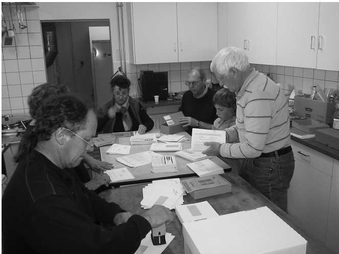
Pendant que l'ecj répète, l'envoi de l'ECJ - info se prépare avec sérieux!

Un grand merci à tous ceux qui ont contribué au bon déroulement musical et administratif de ce camp et