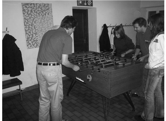
Il faut également prévoir quelques moments de loisirs.