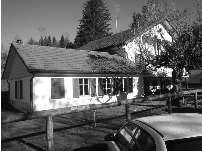
La colonie du Creux-des-Biches, endroit idéal pour un camp musical intensif

L'ecj a également donné un concert fort apprécié le 1er décembre à la Collégiale de St-Ursanne dans le Cadre du Marché de Noël.